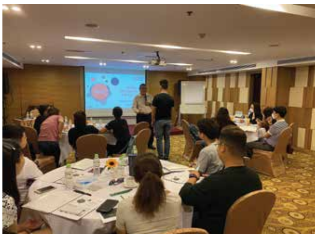
Khóa Học Ra Quyết Định Vấn Đề