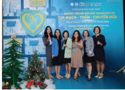
Diễn đàn báo cáo viên Boehringer Ingelheim Nghệ thuật tích hợp các kỹ năng mềm trong Trình bày dữ liệu khoa học