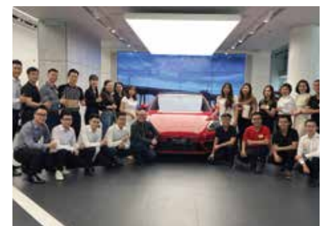
PORSCHE Kỹ năng giao tiếp và dịch vụ khách hàng