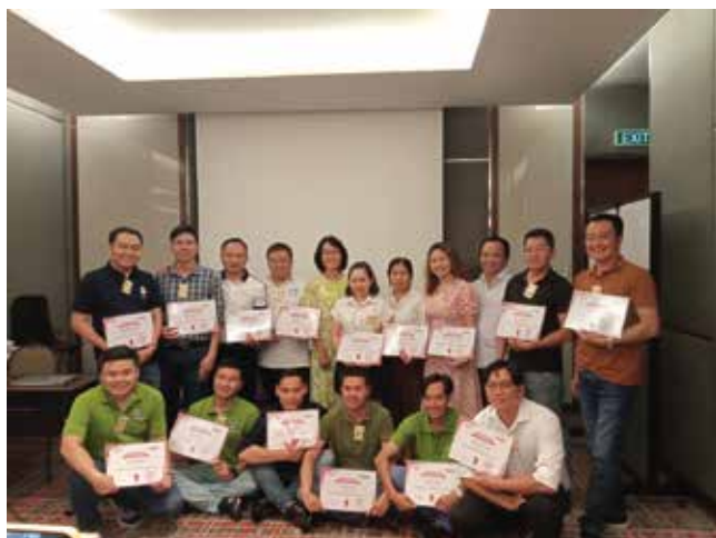
Khóa Học Kỹ Năng Quản Lý Cấp Trung

Các giảng viên là những chuyên gia giàu kinh nghiệm trong nhiều lĩnh vực khác nhau, họ tận tâm nâng cao kỹ năng và kiến thức cho các học viên thông qua đào tạo thực tế, tương tác và áp dụng thực tiễn.