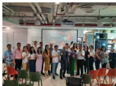
Pfizer Cách cư xử và giao tiếp trong kinh doanh