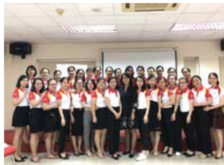
HDBank Kỹ năng quản lý dành cho Quản lý cấp trung