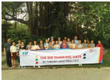
FV Hospital 6 chiếc mũ tư duy - Lý thuyết và thực hành