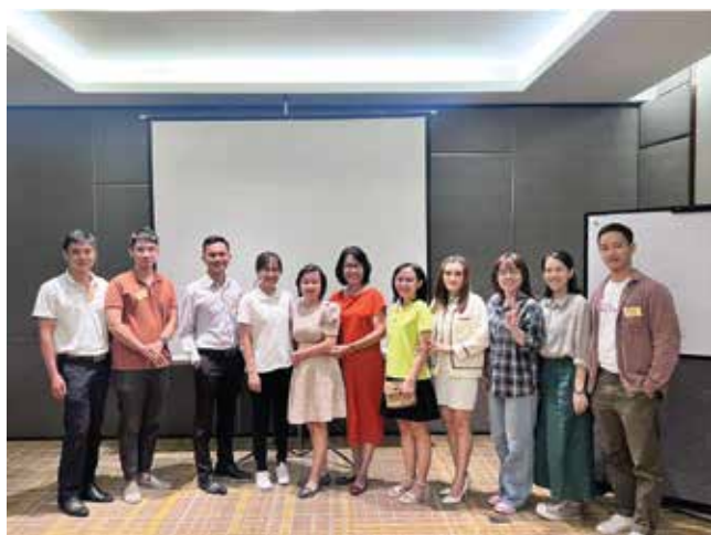
Khóa Học Trí Tuệ Cảm Xúc