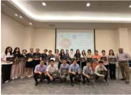
AEON Mall Quản lý thời gian và lập kế hoạch