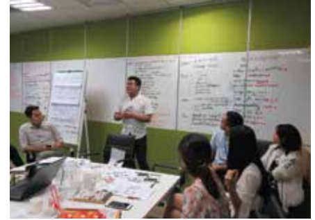
FrieslandCampina Kỹ năng giải quyết vấn đề và ra quyết định