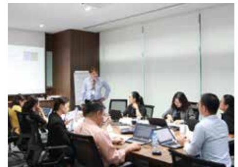
Mapletree Thuyết trình tự tin