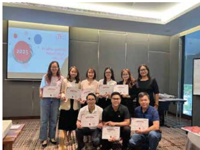
Khóa Học Kỹ Năng Giao Tiếp & Đàm Phán