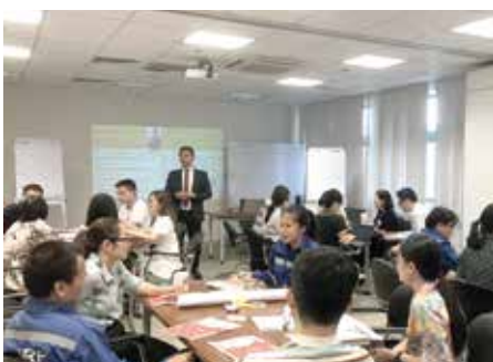
NSRP Tư duy logic và phân biện